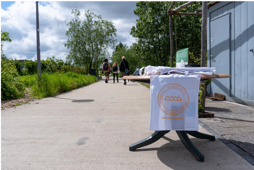
Door Marijke Gips/De Stichting Wijkcollectie (2021)

Een participatief actie-onderzoek naar gemeenschapsparticipatie en gemeenschapsvorming rondom erfgoed in Bospolder-Tussendijken